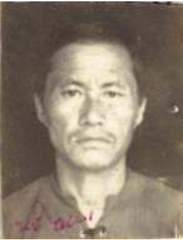
श्री टेकेन्द्र कुरुम्बाड हाडगुम, याडसिंबुड, पान्थर