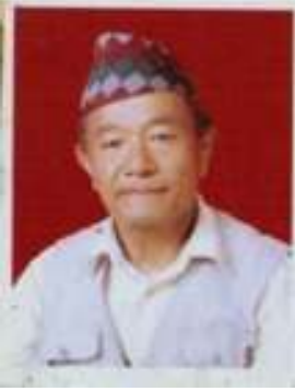
श्री तुलाहर्क कुरुम्बाड आडसराड, पान्थर