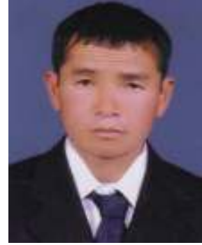
श्री रतधोज कुरुम्बाड आरूबोटे, पान्थर